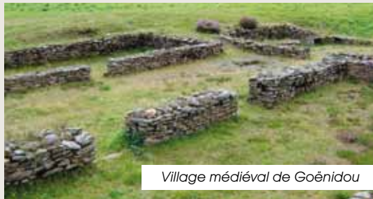
Village médiéval de Goénidou

The standing stone in Kerampeulven. The medieval village of Goénidou (remains). St-Pierre's parish church (XIX c.). Ste-Barbe chapel (ruined). The « Monts d'Arrée » towards Trédudon-le-Moine.