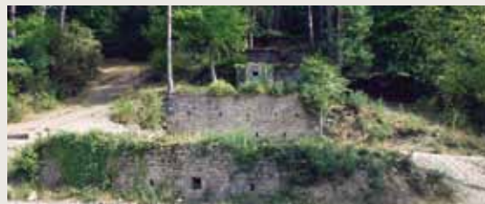
Les laveries de l'ancienne Mine de plomb et d'argent

« Notre-Dame » parish church restored in 1830 (with gothic parts). St-Ambroise chapel (XVII c.). The site of the old silver bearing mine of Locmaria-Berrien.