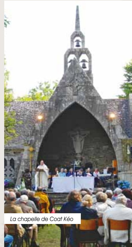
La chapelle de Coat Kéo

St-Pierre parish church (XIX c.) with its XV c. steeple. The chapel of Coat Kéo (1937). The chapels of Quefforc'h, Trenivel, Peridig and Toul ar Groaz.