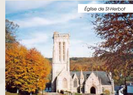
Église de St-Herbot

À 5 km sur la route de Quimper, la « Chapelle Merveilleuse » XV ème - XVI ème , son jubé, le chancel en bois sculpté et son vitrail (1556). At 5 km from Huelgoat towards Quimper is the wonderful chapel of St-Herbot (XV c. and XVI c.) with its rood-loft wooden sculted and a stained glass window (1556).