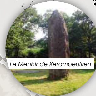
Le Menhir de Kerampeulven