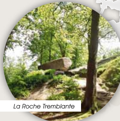
La Roche Tremblante

Le GUIDE des CIRCUITS de PETITE RANDONNÉE Huelgoat et ses environs est en vente au prix de 2 € à l'Office de Tourisme